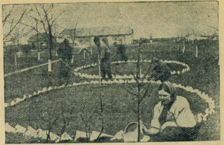
Ставропольский край. С каждым годом всё красивее становятся полевые станы тракторных бригад Петровской опорно-показательной МТС.

Этой весной в полевых станах высаживается несколько тысяч плодовых и декоративных деревьев, много различных цветов.