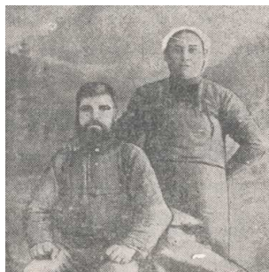
Один из активных участников Ингодинского восстания - староста села Хадакта, арестованный белобандитами, после длительной пытки покончил с собой. Жена, оказывавшая помощь повстанцам, расстреляна белобандитами