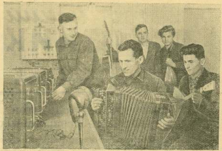
Казахская ССР. Колхоз имени Мичурина Ада-Атинского сельского района—один из передовых в республике. Годовой доход артели в 1953 году составил пять миллионов рублей. В колхозном поселке имеются своя электростанция, клуб, киноустановка и радиоузел.

В постановлении собрания особое внимание уделено развитию общественного животноводства и обеспечению его хорошими помещениями. В 1954 году намечено закончить строительство телятника и свинарника, построить коровник на 100 голов, две кошары на 1400 голов, два жилых дома для работников животноводства, крытый ток и ряд других построек, а также радиофицировать все жилые дома на фермах.