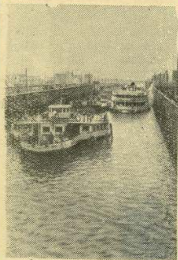
Молотов. Началась промышленная эксплуатация судоходного шлюза Камского гидроузла. НА СНИМКЕ: шлюзуются буксирный пароход «Буран» (на переднем плане) и пассажирский пароход «Иван Папанин».