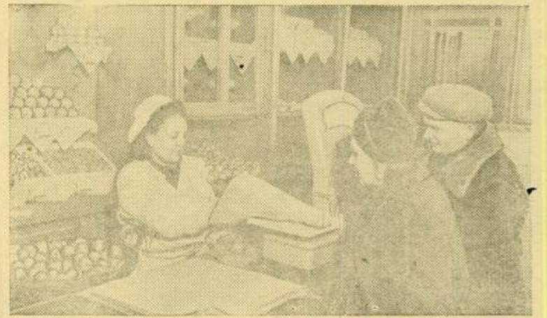
В Одессе открыт еще один магазин Облпотребсоюза по продаже сельскохозяйственных продуктов, поступающих от колхозов для реализации на комиссионных началах.

На этом же собрании принято в колхоз 9 новых семей-