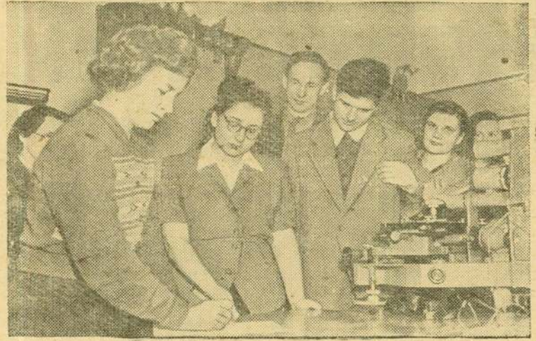
Москва. Сбор подписей под Обращением Всемирного Совета Мира против подготовки атомной войны.

По этим пунктам механизаторы Улетовской МТС вызвали на социалистическое соревнование механизаторов Ингодинской МТС Читинского района.