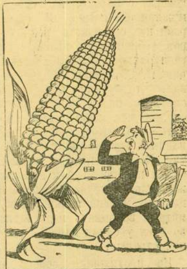
Смолит он на кукурузу, как на лишнюю обузу.