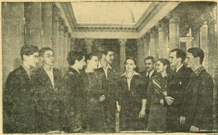
Двери Московского университета широко открыты для советской молодежи. На его 12 факультетах учатся около 22 тысяч человек, среди них юноши и девушки 57 национальностей.

НА СНИМКЕ: группа студентов различных национальностей в фойе Дома культуры МГУ.