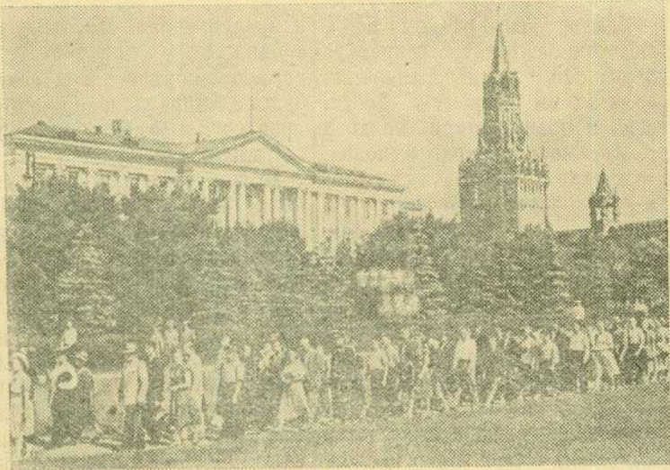
Московский Кремль открыт для свободного посещения трудящимися. НА СНИМКЕ: трудящиеся на территории Кремля.

Покупатели требуют, чтобы эти неполадки в магазине были устранены. Е. ЦЫМБАЛЯК.