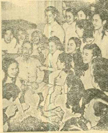
Демократическая Республика Вьетнам. Президент республики Хо Ши Мин среди школьников.