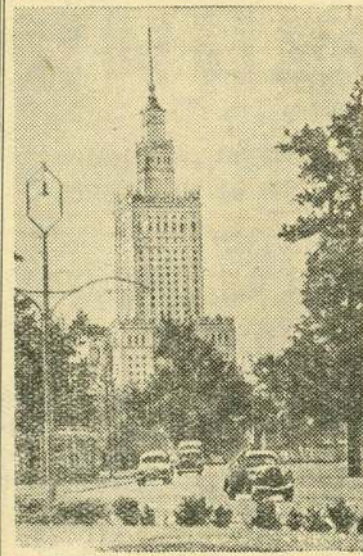
В столице Польской Народной Республики — Варшаве — завершается строительство Дворца культуры и Науки имени И. В. Сталина, сооружаемого силами и средствами СССР в дар польскому народу.

НА СНИМКЕ: вид на Дворец со стороны Сасского сада.