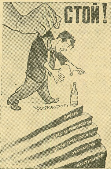
Плакат художника Б. Ефимова и Н. Долгорукова, выпущенный ИЗОГИЗ.