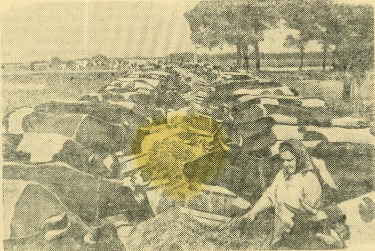
Литовская ССР. Совхоз «Пагоюс» Арегалского района — передовое хозяйство республики. За 10 месяцев нынешнего года на каждую корову здесь надоено по 3.230 килограммов молока. НА СНИМКЕ: высокопродуктивные коровы совхоза «Пагоюс» Арегалского района. Справа — доярка Я. Урбонене.