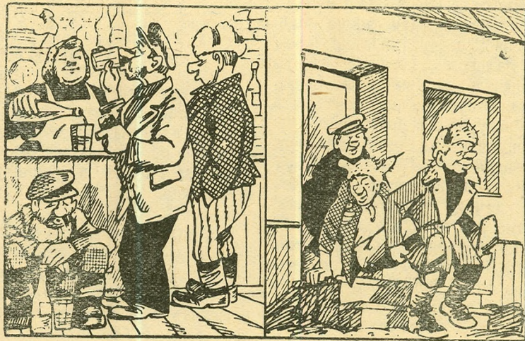
Пивная новая открылась — вразлив торгует и...