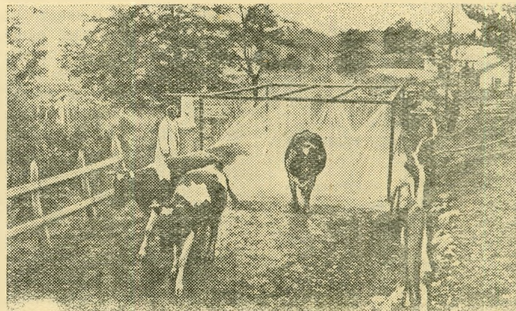
Краснодарский край. Хорошие условия созданы для содержания скота в Лазаревском мясо-молочном совхозе. В прошлом году от каждой коровы было получено по 5258 килограммов молока. НА СНИМКЕ: перед выходом на прогулку животные принимают циркулярный душ.

М. ТИМОФЕЕВ, чабан колхоза «Объединение».