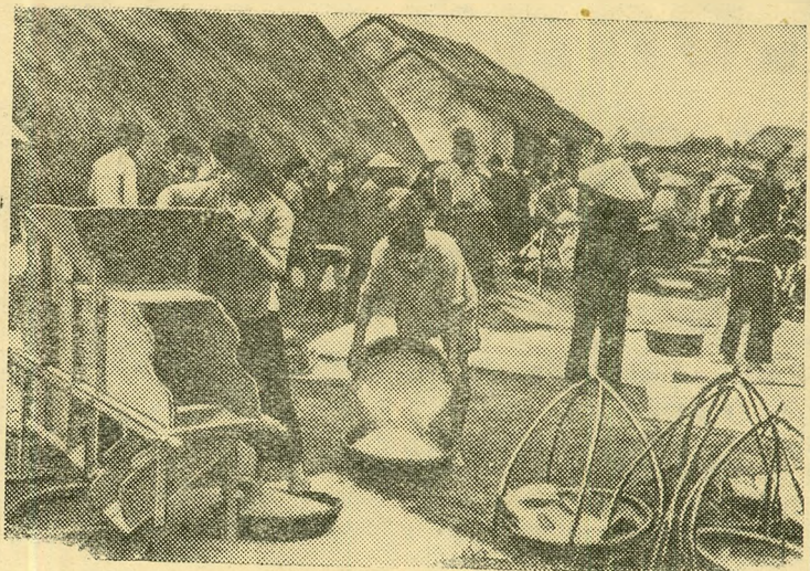
Демократическая Республика Вьетнам. Сдача риса государству.

Глубокие преобразования происходят в румынской деревне. Все больше и больше трудящихся крестьян, убеждаясь в преимуществах коллективного труда, постепенно переходят от индивидуального ведения хозяйства к общественному. В настоящее время в стране имеется более 5600 коллективных хозяйств и товариществ по совместной обработке земли (ТОЗов), объединяющих свыше 360500 крестьянских хозяйств. В настоящее время в стране имеется 220 МТС, располагающих 16 тысячами тракторов (в переводе на 15—сильные).