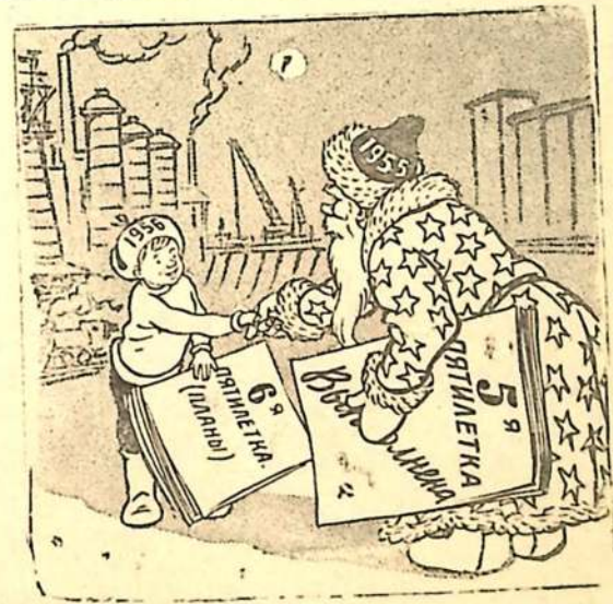
—Я подытожил, а ты начинай!