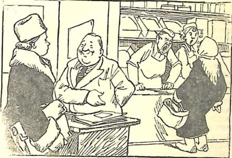
—У меня продавцы все свое «мастерство» в работу вкладывают.