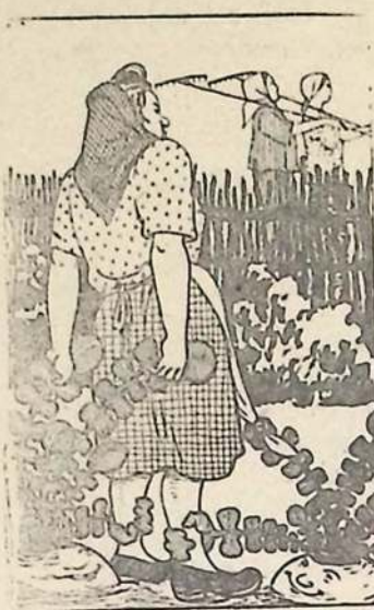
Своя репка держит крепко.

В колхозе им. Чапаева в 1955 году многие колхозники не выработали минимума трудовой.