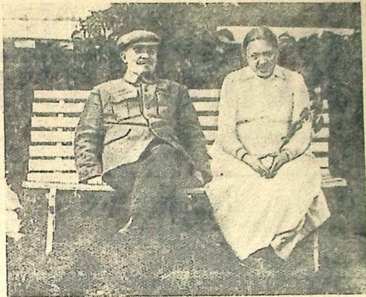
В. И. Ленин и Н. К. Крупская в Горках. 1922 год.