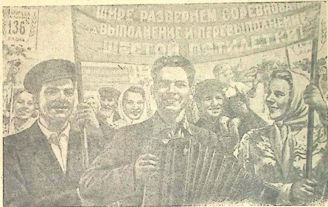
С ПРАЗДНИКОМ ПЕРВОГО МАЯ!