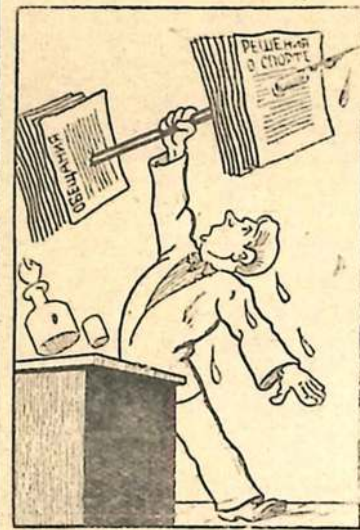
Он на целых три килограмма улучшил свой рекорд по обещаниям.

провести еще в декабре. Все это объясняется тем, что районный комитет физкультуры и спорта не окружил себя активом, мало ведет работы среди молодежи о значении физической культуры, недостаточно разъясняет комплекс норм ГТО. Пока ограничивается одними обещаниями и указаниями и райком ВЛКСМ. Конечно, выйти на трибуну.